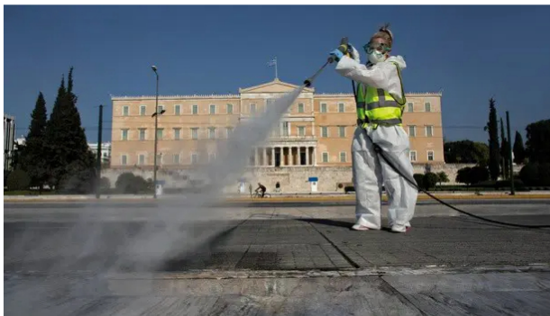
Σε ρυθμούς COVID-19

Οι αφηγήσεις υγειονομικών, γιατρών και νοσηλευτών, άμεσων «αφηγητών» της ιστορίας από πρώτο χέρι, σε συνδυασμό με μια απόπειρα σκιαγράφησης της «παγκόσμιας» μεγάλης εικόνας, δίνουν στους «Παρόντες» μια αίσθηση κατ' επείγοντος, αλλά συνάμα και μια διαλεκτική διάθεση που υπερβαίνει το «τώρα» και κοιτάει προς το «αύριο». Και αυτό αποτελεί αναμφίβολα το μεγάλο παράσημο για τον Αυγερόπουλο και τους συντελεστές στο επίπεδο της πολιτικής και οικονομικής ανάλυσης.